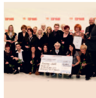
Gewinner Top Hair Salon des Jahres